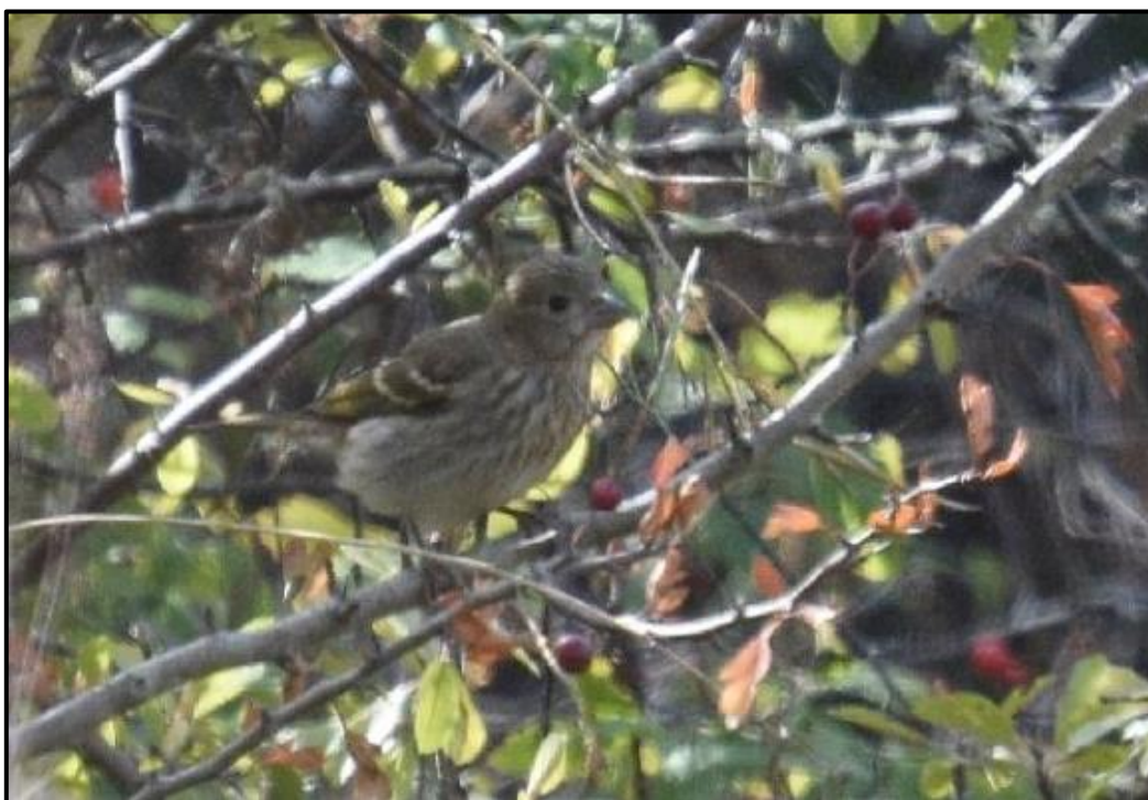
Roselin cramoisi ( Erythrurus erythrurus ) – Île d'Yeu / Vendée (85)

1 1A (phot.) le 04/09 au Chiron Bureau / Île d'Yeu (85) (V. Auriaux & J.-M. Guilpain).