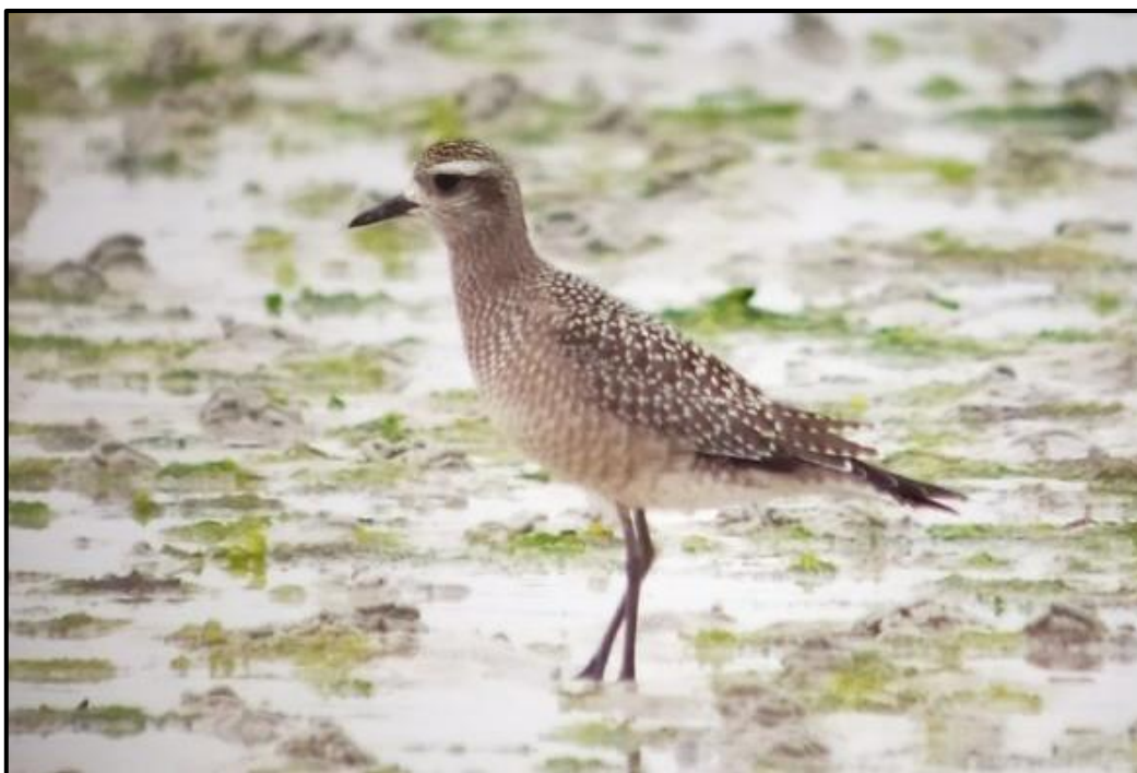
Pluvier bronzé ( Pluvialis dominica ) – Tréfléz / Finistère (29)

Chevalier bargette ( Xenus cinereus ) – Terek Sandpiper :