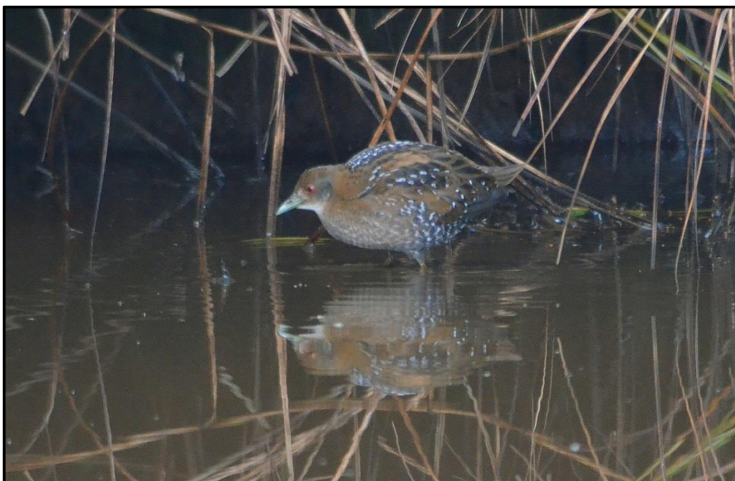
Marouette de Baillon ( Zapornia pusilla ) – Locmariaquer / Morbihan (56)

1 1A (phot.) du 08 au 12/09 à l'étang de Kerpenhir / Locmariaquer (56) (V. Ponelle, A. Lamek, G. Normand et al. ). Oiseau potentiellement présent depuis le 06/09.