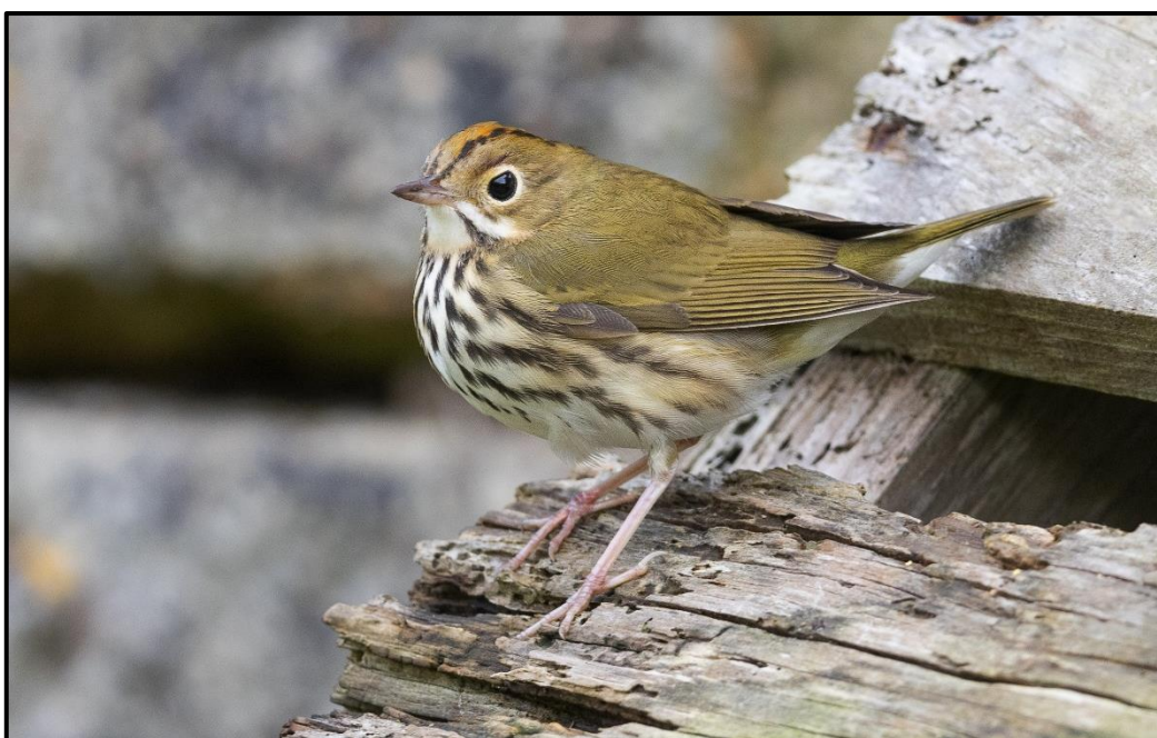
Paruline couronnée ( Seiurus aurocapilla ) – Molène / Finistère (29)

Un oiseau de première année (phot.) stationne durant 6 jours, du 27/09 au 02/10, sur l'Île de Molène (29) (S. Wroza et al. ). Sous réserve d'homologation, il s'agit de la première mention française.