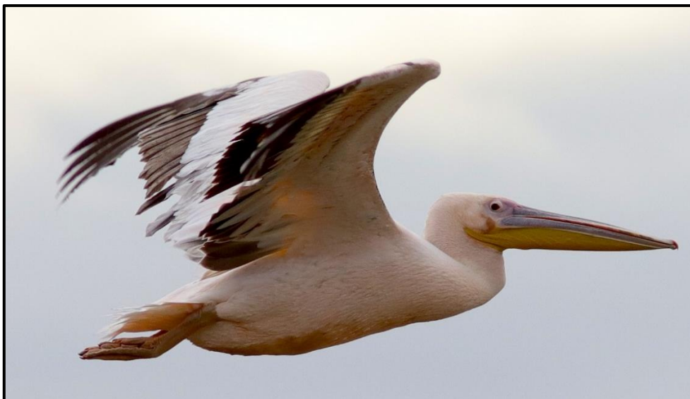
Pélican blanc ( Pelecanus onocrotalus ) – Arles / Bouches-du-Rhône (13)

3 (phot.) non bagués à partir du 14/09 en Camargue / Arles (13) (P. Foulquier, B. Rivière-Lachaud, A. Pellegrin, T. Laurent et al. ). Observation à mettre en lien avec les 2 individus notés en août à Piémanson / Arles (13).