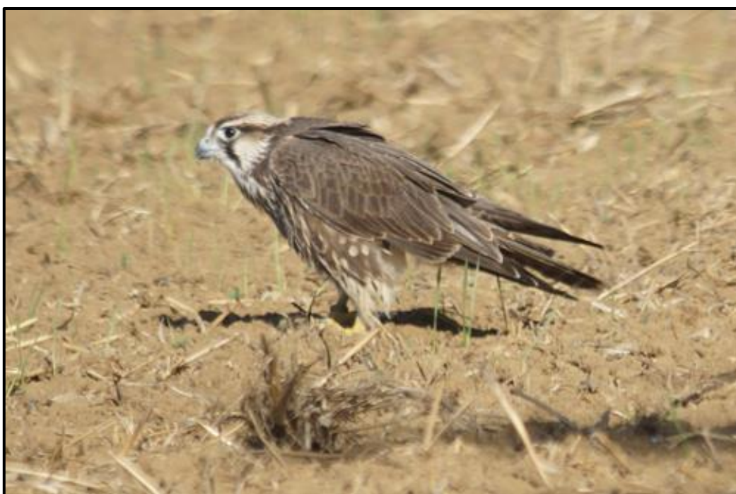
Faucon lanier ( Falco biarmicus ) – Saint-Denis-d'Oléron / Charente-Maritime (17) (© O. Laluque)

1 1A (phot.) le 20/09 au Phare de Chassiron / Saint-Denis-d'Oléron (17) (O. Laluque). Individu porteur d'une bague au tarse droit.