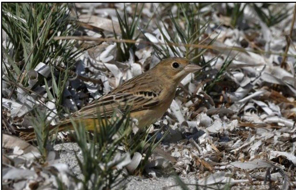
Bruant mélanocéphale / à tête rousse ( Emberiza melanocephala / bruniceps ) – Bonifacio / Corse-du-Sud (2A)

1 1A (phot., enregistré et bagué) du 12 au 16/09 à l'Étang de Piantarella / Bonifacio (2A) (P. Devoucoux, G. Caucanas et al. ).