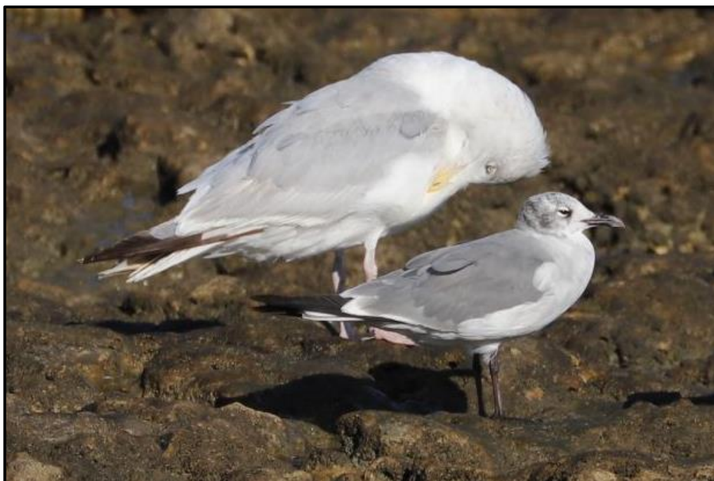
Mouette atricille ( Leucophaeus atricilla ) – Île-d'Aix / Charente-Maritime (17)

L'individu de 3 ème année (phot.) est observé jusqu'au 02/09 à la Pointe du Jeamblet / Île-d'Aix (17).