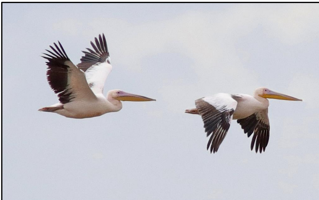
Pélican blanc ( Pelecanus onocrotalus ) – Arles / Bouches-du-Rhône (13)

Aigrette des récifs ( Egretta gularis ) – Western Reef Heron :