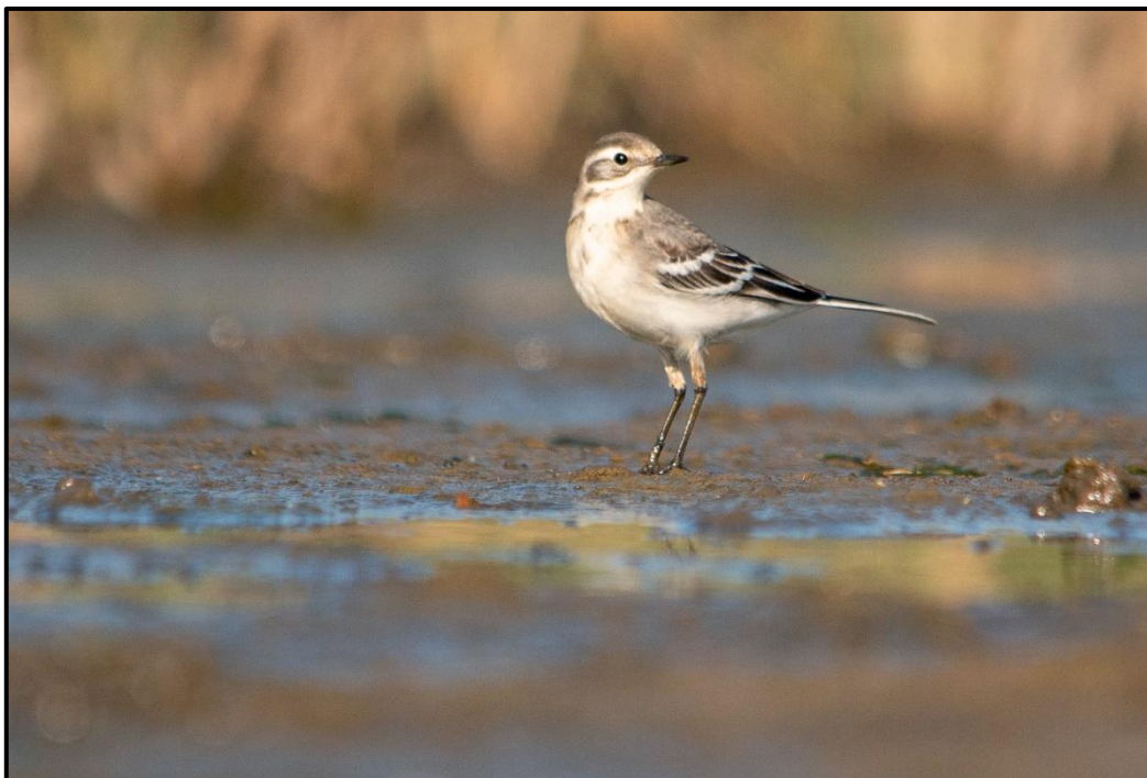
Bergeronnette citrine ( Motacilla citreola ) – Plovan / Finistère (29)

Fauvette épervière ( Sylvia nisoria ) – Barred Warbler :