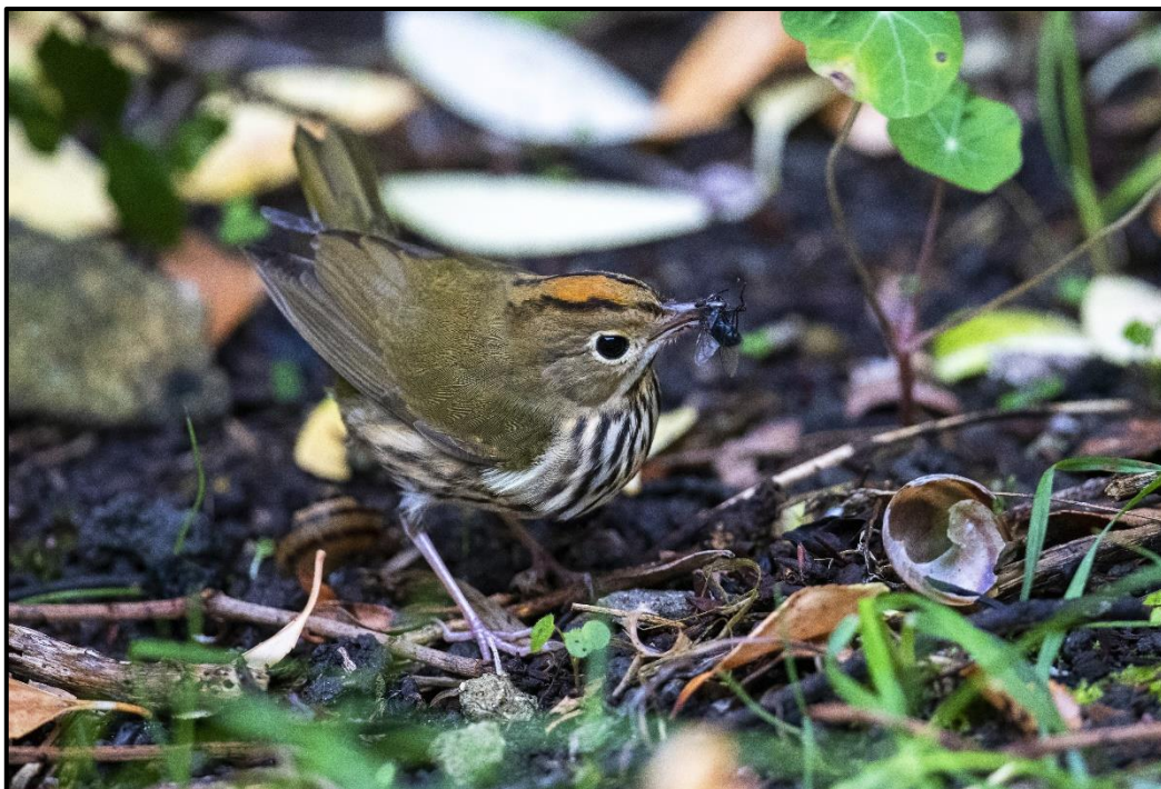
Paruline couronnée ( Seiurus aurocapilla ) – Molène / Finistère (29)