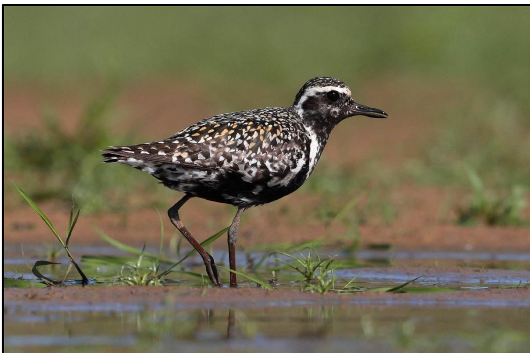
Pluvier fauve ( Pluvialis fulva ) – Saint-Fargeau / Yonne (89)