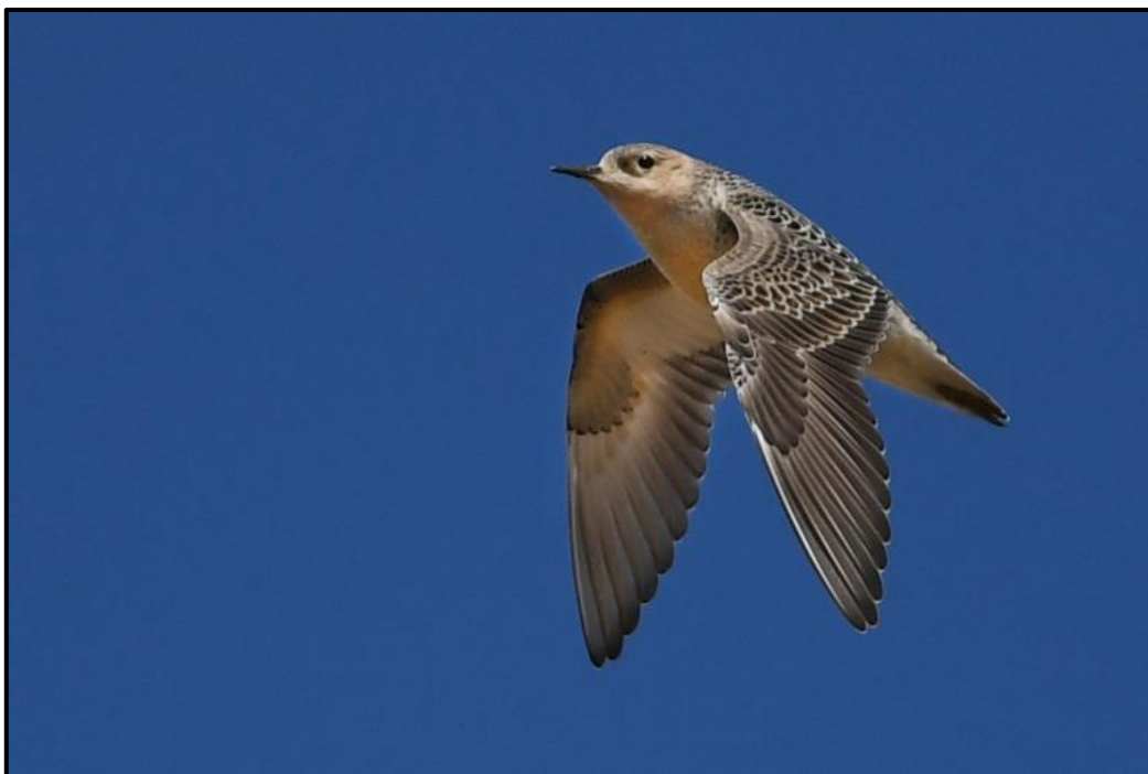
Bécasseau rousset ( Tryngites subruficollis ) – Saint-Jean-Trolimon / Finistère (29)

Chevalier à pattes jaunes ( Tringa flavipes ) – Lesser Yellowlegs :