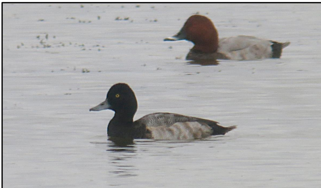
Fuligule à tête noire ( Aythya affinis ) – Outines / Marne (51) (© P. Zimmerlin)

1 mâle (phot.) le 24/09 à l'Étang du Grand Coulon / Outines (51) (P. Zimmerlin).