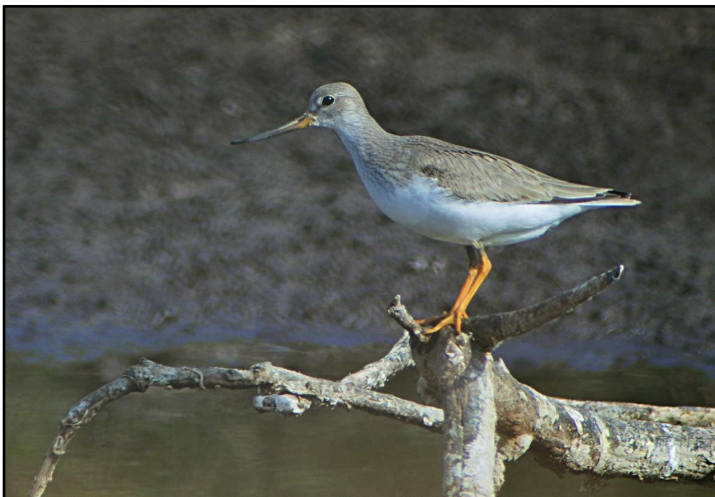
Chevalier bargette ( Xenus cinereus ) – Borgo / Haute-Corse (2B) (© A. Leoncini)

1 (phot.) du 12 au 18/09 sur l'île de Damiano / Borgo (2B) (A. Leoncini et al. ) et 1 (phot.) du 14 au 23/09 sur l'étang du Campagnol / Gruissan (11) (D. Clément et al. ).