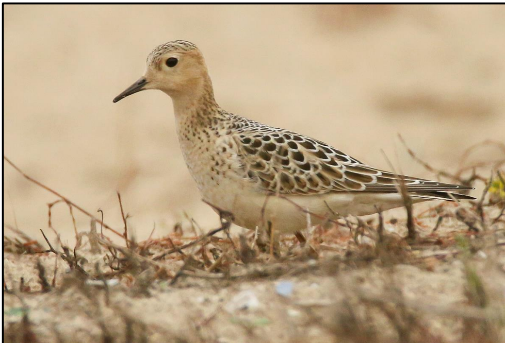
Bécasseau rousset ( Tryngites subruficollis ) – Saint-Jean-Trolimon / Finistère (29)

1 1A (phot.) le 10/09 à Kervardez / Plovan (29) (C. Morvan et al. ) et 1 1A (phot.) du 11 au 14/09 à Kerfeuteun / Saint-Jean-Trolimon (29) (C. Morvan, S. Reyt et al. ).