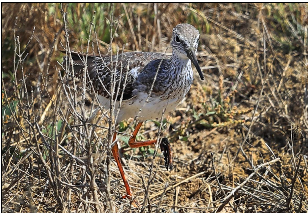
Chevalier à pattes jaunes ( Tringa flavipes ) – Le Teich / Gironde (33)

Chevalier grivelé ( Actitis macularius ) – Spotted Sandpiper :