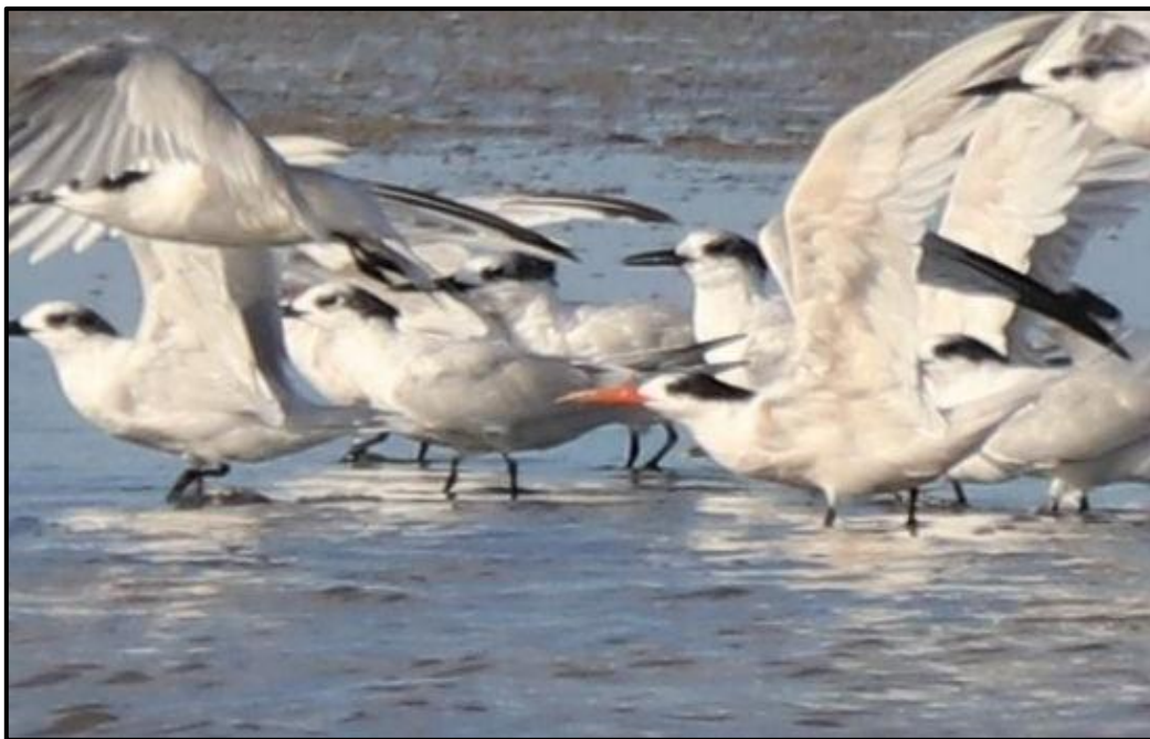
Sterne élégante ( Sterna elegans ) – Arles / Bouches-du-Rhône (13)

L'individu (phot.) observé depuis le 27/08 au Grau-du-Roi (30) y est revu jusqu'au 07/09 et un individu (phot.) est noté du 07 au 13/09 à la Digue de Paulet / Arles (13). A noter que le 07/09, l'individu camarguais est observé jusqu'à 18h alors qu'il part en vol vers la mer, l'individu héraultais est trouvé à partir de 20 heures sur son site habituel gardois, serait-ce un seul et même individu ?